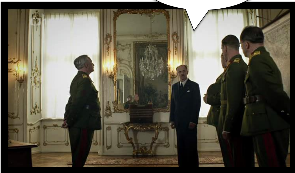
Beneš při rozmluvě s generály 29. září 1938.

Ještě nikdy nebyly armáda a národ tak zajedno.